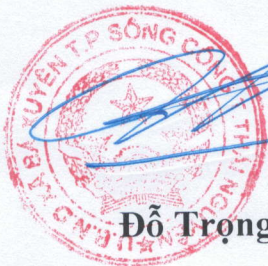
Đỗ Trọng Lư