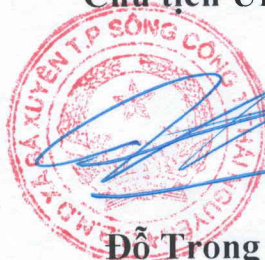
Đỗ Trọng Lư